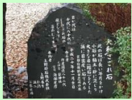
小さな石が粘土等に混ざり大きな石になったさざれ石