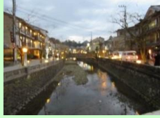
志賀直哉はじめ多くの文豪が訪れた情緒ある城崎の街並み