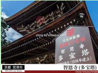
智恩寺 ご本尊 文殊菩薩 日本三文殊といわれています。