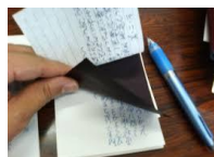
(複写はがき) カーボンを使って、控えを残します。